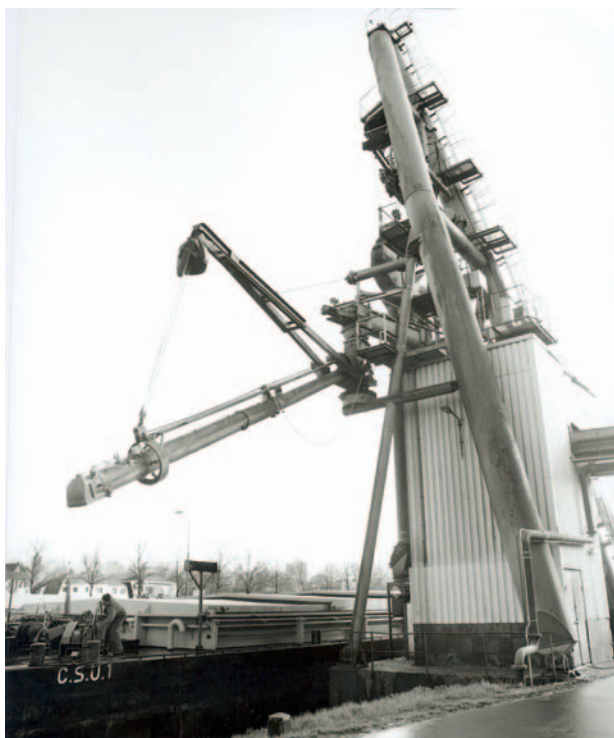
De kraan bij de Cereol fabriek.